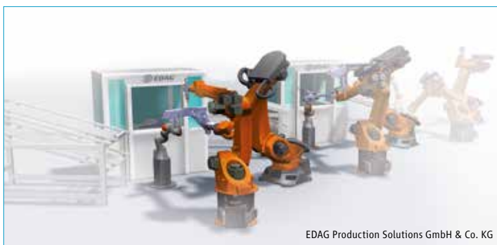
EDAG Production Solutions GmbH & Co. KG

ABB, AGOR, ArtiMinds Robotics, ASM Assembly Systems, Daimler, HAHN Robotics, ICARUS Consulting, KEBA, KUKA Industries, Leopold Kostal, Miele